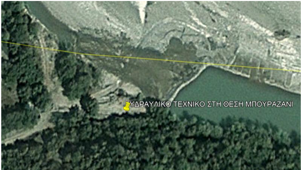
ΕΙΚΟΝΑ 2. ΧΩΡΟΘΕΤΗΣΗ ΥΔΡΑΥΛΙΚΩΝ ΤΕΧΝΙΚΩΝ ΠΡΟΣΑΓΩΓΗΣ ΡΟΗΣ ΠΟΤΑΜΟΥ ΣΑΡΑΝΤΑΠΟΡΟΥ ΕΝΤΟΣ ΥΦΙΣΤΑΜΕΝΟΥ ΔΙΚΤΥΟΥ ΤΟΕΒ

Σκοπός, λοιπόν, του εν λόγω έργου είναι αφενός μεν η κατασκευή νέου τεχνικού εισόδου στο σημείο τροφοδοσίας της υφιστάμενης μη επενδεδυμένης τάφρου από την κοίτη του ποταμού και αφετέρου η επένδυση του πυθμένα και των τοιχωμάτων της μη επενδεδυμένης τάφρου στο μήκος των 60μ και η μηκοτομική διόρθωση του πυθμένα της. Συγκεκριμένα, το τεχνικό εισόδου θα αποτελείται από πυθμένα Ο/Σ αγκυρουμένο με χαλινό εντός του υπεδάφους και συγκλίνοντες πλευρικούς πτερυγότοιχους Ο/Σ με τους κατάλληλους τοίχους αντεπιστροφής στην ανάντη διατομή για την προστασία των πρανών της κοίτης του ποταμού. Η προστασία των πρανών της κοίτης σε συνέχεια με τους τοίχους αντεπιστροφής επιτυγχάνεται με την κατάλληλη διάταξη συρματοκιβωτίων στην στέψη των οποίων διαμορφώνεται διάζωμα από Ο/Σ. Κατά πλάτος της ανάντη διατομής εισόδου του εν λόγω τεχνικού διαμορφώνεται τοιχίο μεταξύ των πλευρικών πτερυγότοιχων σε συνέχεια των τοίχων αντεπιστροφής, τμήμα στο οποίο τοποθετούνται δύο μεταλλικά θυροφράγματα αφενός μεν για την προσαγωγή και τον έλεγχο της ροής και αφετέρου για την προστασία του αρδευτικού δικτύου από τα πλημμυρικά φαινόμενα του ποταμού. Παράλληλα, για την βελτίωση της πρόσβασης τόσο των εργαταξιακών μηχανημάτων κατά την διάρκεια του έργου αλλά και των οχημάτων αγροτικής χρήσης μετά το πέρας του έργου στα πλαίσια του εν λόγω έργου προβλέπεται η επίστρωση της κεντρικής αγροτικής οδού με αμμοχαλικώδη υλικά.