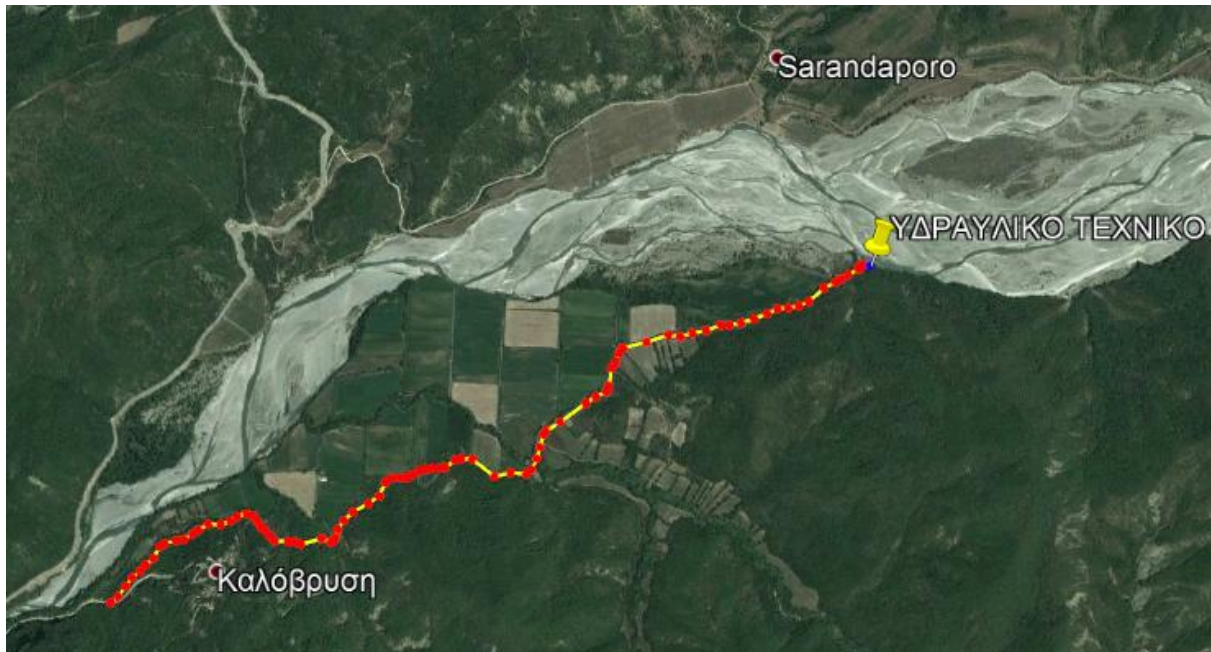
ΕΙΚΟΝΑ 3. ΟΡΙΖΟΝΤΙΟΓΡΑΦΙΑ ΚΕΝΤΡΙΚΗΣ ΑΓΡΟΤΙΚΗΣ ΟΔΟΥ ΠΡΟΣ ΑΠΟΚΑΤΑΣΤΑΣΗ ΒΑΤΟΤΗΤΑΣ ΣΥΝΟΛΙΚΟΥ ΜΗΚΟΥΣ 3300m

Μεταξύ των σπονδύλων της τάφρου αλλά και μεταξύ της τάφρου και του τεχνικού εισόδου προβλέπεται η διαμόρφωση αρμών στεγάνωσης τόσο στην πλάκα πυθμένα όσο και στα τοιχώματα, με ειδική στεγανωτική ταινία τύπου plasticjoint.