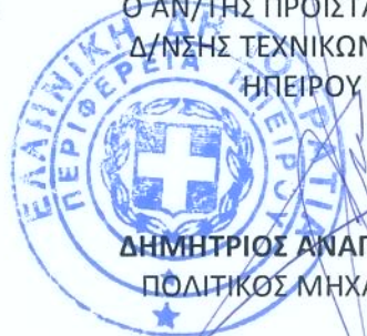
ΔΗΜΗΤΡΙΟΣ ΑΝΑΓΝΩΣΤΟΥ ΠΟΛΙΤΙΚΟΣ ΜΗΧΑΝΙΚΟΣ

Ο ΑΝ/ΤΗΣ ΠΡΟΪΣΤΑΜΕΝΟΣ Δ/ΝΣΗΣ ΤΕΧΝΙΚΩΝ ΕΡΓΩΝ ΗΠΕΙΡΟΥ