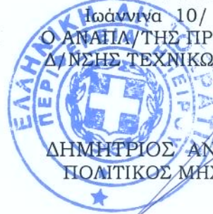
ΔΗΜΗΤΡΙΟΣ ΑΝΑΓΝΩΣΤΟΥ ΠΟΛΙΤΙΚΟΣ ΜΗΧΑΝΙΚΟΣ

Ιωάννινα 10/ 1/2018 Ο ΑΝΑΠΛ/ΤΗΣ ΠΡΟΙΣΤΑΜΕΝΟΣ Δ/ΝΣΗΣ ΤΕΧΝΙΚΩΝ ΕΡΓΩΝ ΗΠΕΙΡΟΥ