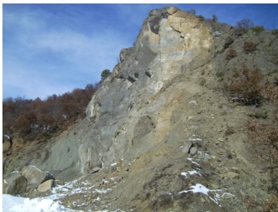
17. X= 235962 & \Psi= 4458136 - ΧΘ 11+400

Θραύσεις - καθιζήσεις στο οδόστρωμα σε μήκος 50 m +50 m . Τα εδαφικά υλικά και τα επιχώματα, λόγω σύστασης, δέχονται μεγάλο μέρος από τα νερά των βροχών με συνέπεια να υφίστανται μείωση των ήδη χαμηλών διατμητικών αντοχών τους