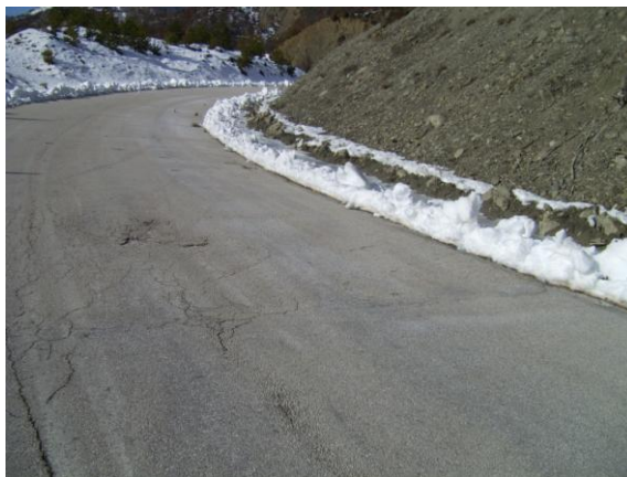
16. X= 235805 & \Psi= 4458259 - ΧΘ 11+200