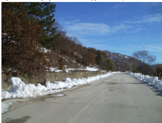
19. X= 236787 & \Psi= 4457581 - ΧΘ 12+350

Θραύσεις - καθιζήσεις στο οδόστρωμα σε μήκος 30 m . Τα εδαφικά υλικά και τα επιχώματα, λόγω σύστασης, δέχονται μεγάλο μέρος από τα νερά των βροχών με συνέπεια να υφίστανται μείωση των ήδη χαμηλών διατμητικών αντοχών τους την γέφυρα.