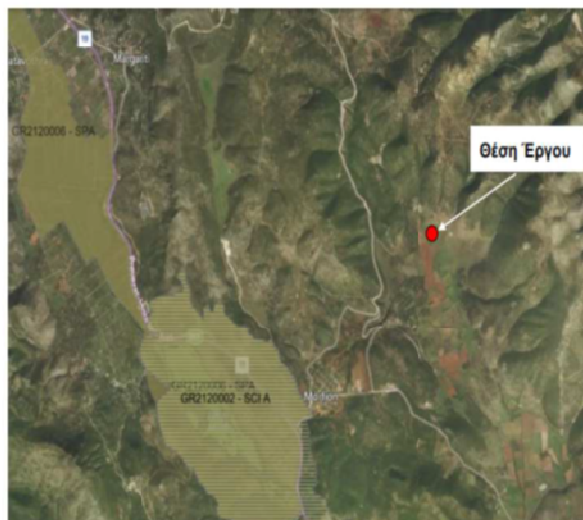
Εικόνα 2.2.1: Περιοχές NATURA 2000 στην περιοχή μελέτης

Η Μελέτη Περιβαλλοντικών Επιπτώσεων αφορά στην εγκατάσταση και λειτουργία μονάδας παραγωγής ηλεκτρικής ενέργειας από φ/β πάρκο, ισχύος 15,028MWp , στην Τ.Κ. Σπαθαραίοι, Δ. Ηγουμενίτσας, με αριθμό άδειας παραγωγής, από τη Ρ.Α.Ε., 1041/2020 .